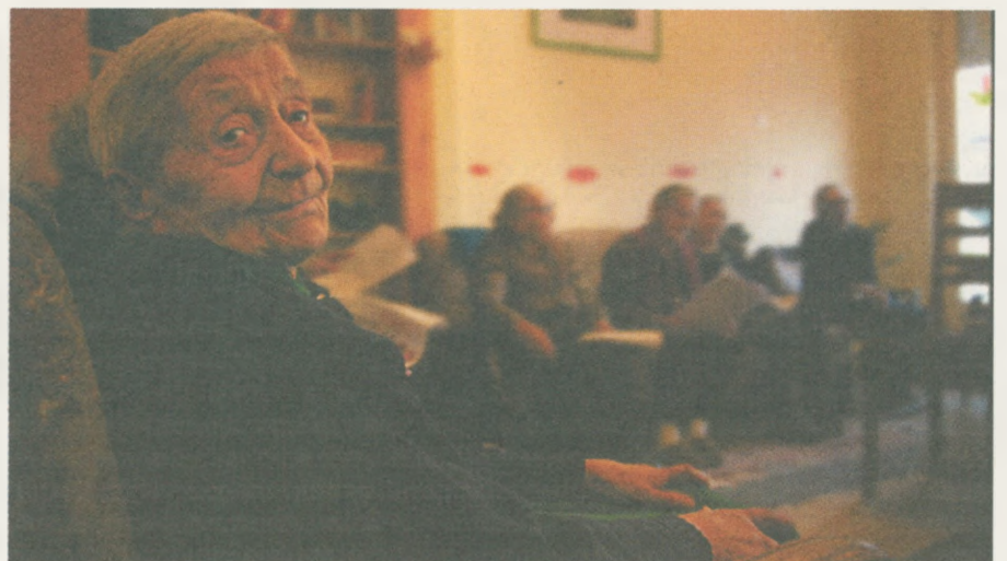
Die Einsamkeit ist für viele ältere Menschen eine schwer zu tragende Last. Der Caritas-„Club der Hoffnung“ ist beliebter Treffpunkt und Wärmestube.

Der Fotograf Roland Reuter hat in der Region Satu Mare in Rumänien Caritas-Einrichtungen besucht. Seine Bilder können vom 16. bis 28. Februar im Haus Marillac besichtigt werden. Bei der Vernissage am 16. Februar, 19.30 Uhr, gewährt Hajni Ritli Einblicke in den Alltag der Menschen in Rumänien. Seit mehr als 15 Jahren unterstützt die Caritas Innsbruck Sozialprojekte in der Partnerdiözese Satu Mare in Rumänien und schenkt damit Hoffnung auf eine bessere Zukunft.