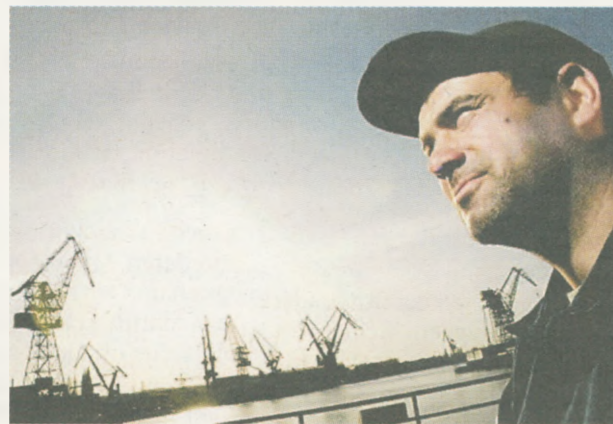
Werftarbeiter arbeitslos. Die Gesetze des Marktes sind kein Naturereignis, sie müssen menschlich gestaltet werden.

Aufruf zum Handeln. Das Sozialkompodium sei kein „Katechismus“ im Sinne eines abgeschlossenen Lehrgebäudes, meint Markus Schlagnitweit. Vielmehr handle es sich dabei um eine umfassende und systematische Zusammenfassung der bisherigen Sozialverkündigung der Kirche, die allerdings offen ist für neue Fragen und Entwicklungen. „Die Soziallehre der Kirche war immer schon eine Baustelle. Ausgehend von brennenden Fragen der jeweiligen Zeit wurde sie weiterentwickelt“, meint Schlagnitweit. In diesem Sinn sei das Kompodium auch kein trockenes Nachschlagewerk, sondern ein Aufruf zum persönlichen und zum kirchlichen Engagement. Ausdrücklich werden die Ortskirchen auf lokaler, regionaler und nationaler Ebene aufgefordert, sich in ihrem Umfeld den Herausforderungen zu stellen, die das Wohl, die Würde und die Rechte der Menschen, den solidarischen Zusammenhalt, die Umwelt und den Frieden betreffen.