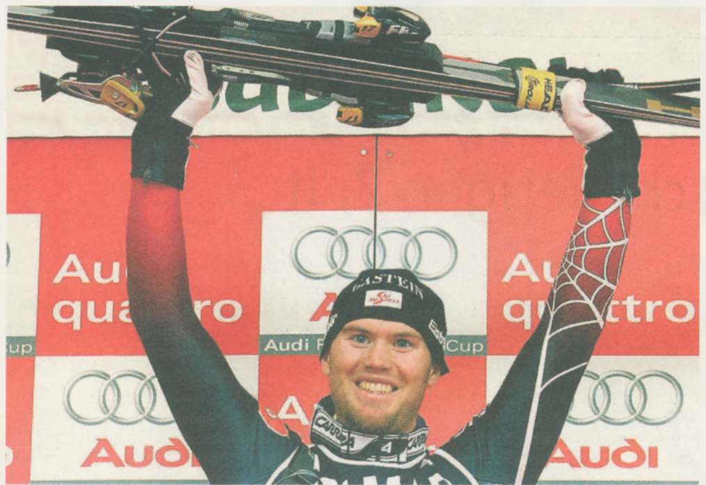
Hans Grugger: Sieger beim FIS Weltcup Super-G in Gröden am 16. Dezember 2005.

Vom 10. bis 26. Februar finden in Turin die 20. Olympischen Winterspiele statt, vom 10. bis 19. März die Paralympics, die Wettkämpfe für Menschen mit Behinderung. Die Hauptstadt des Piemont ist nicht nur eine bekannte Industriemetropole (Fiat-Konzern); das Turiner Grabtuch zieht jährlich Hunderttausende Pilger an. In der Mitte des 19. Jahrhunderts begann Johannes Bosco die sozial entwurzelten und arbeitslosen Jugendlichen von Turin um sich zu sammeln. In seinem „Oratorium“ fanden sie eine neue Heimat. Bis heute ist die Jugendarbeit der Schwerpunkt der Salesianer/-innen Don Boscos.