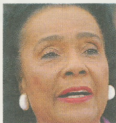
Coretta King setzte sich seit dem Tod ihres Mannes Martin Luther King für Menschenrechte und Menschenwürde ein.

Coretta King, Witwe des 1968 ermordeten Menschenrechtsaktivisten und Friedensnobelpreisträgers Martin Luther King, ist am 30. Jänner im Alter von 78 Jahren gestorben. Um das politische Erbe ihres Mannes fortzusetzen, gründete Coretta King 1969 das King-Zentrum in Atlanta (Georgia) und engagierte sich für die Rechte der Schwarzen und Minderheiten und für einen gewaltfreien sozialen Wandel. Ihr Kampf gegen Armut, Hunger, Rassismus und Arbeitslosigkeit brachte Coretta King internationales Ansehen ein. Ursula Plassnik drückte im Namen der EU-Ratspräsidentschaft ihr tiefes Mitgefühl und Beileid aus.