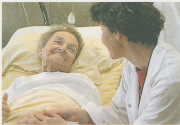
Patientenverfügung: Klärende Gespräche sind wichtig.