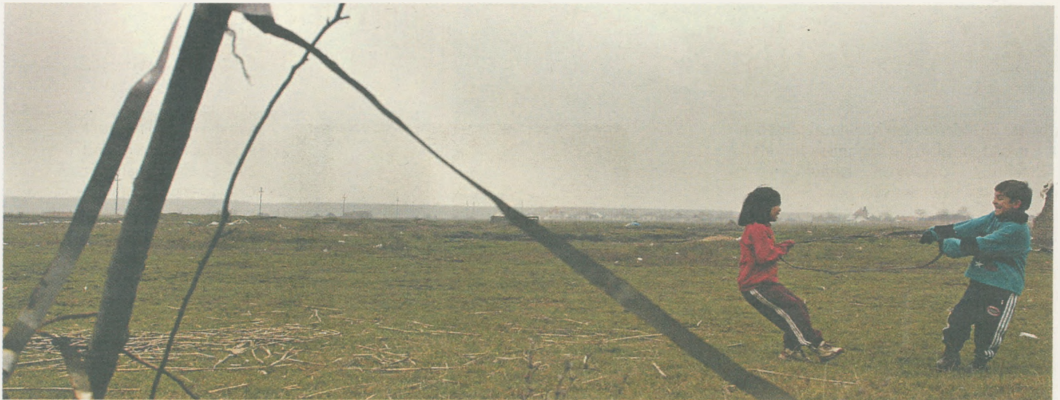
Für viele Kinder in Rumänien zeigt sich das Leben vor allem von seiner tristen Seite: ihre Eltern sind arbeitslos, die Familien leben in verfallenen Häusern ohne fließendes Wasser und ohne Heizung.