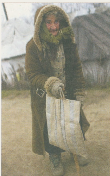
Alte Menschen leiden besonders unter Armut und Einsamkeit.