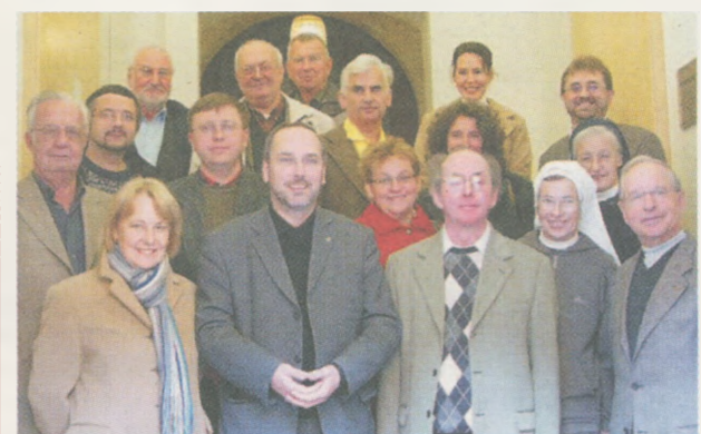
Das Team der Gesprächsoase in Innsbruck.