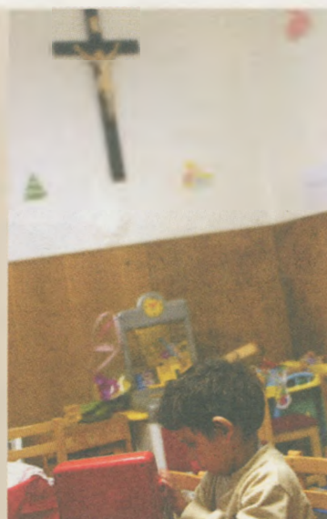
Im Roma-Kindergarten: ein Partnerschaftsprojekt der Caritas.