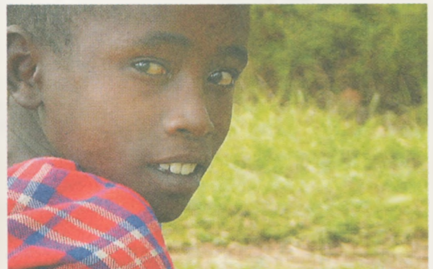
Viele Kinder in Afrika sind durch das AIDS-Virus zu Vollwaisen geworden. „Bruder und Schwester in Not“ unterstützt diese Kinder, um ihnen eine bessere Zukunft zu ermöglichen. BSIN