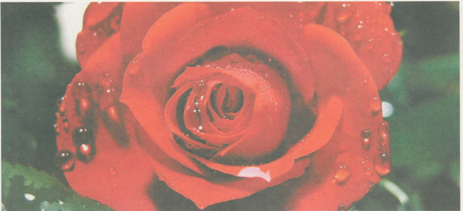
Herrliche Blumenpracht mit FLP-Gütesiegel, produziert unter fairen Bedingungen.