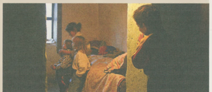
Die Lebenssituation der Roma ist gekennzeichnet durch Ausgrenzung und Armut.

In den Straßenkinderzentren, Tagesstätten, Armenküchen und Kindergärten der Caritas finden Menschen in Rumänien neben Essen und einem Dach über dem Kopf auch die Zuwendung, die sie so dringend brauchen. Kontakt: Andrä Stigger, Auslandsreferent der Caritas der Diözese Innsbruck. Tel. 0512/7270-63.